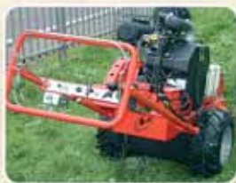
Leggera e molto facile da usare Très léger et très facile à utiliser