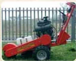
Manubrio regolabile in altezza Mange réglable en hauteur