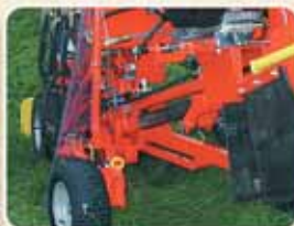
Ruote frontali regolabili in larghezza Roues frontales réglables en largeur