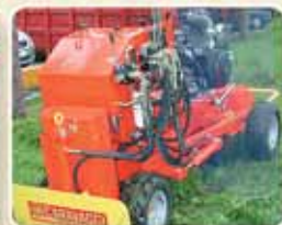
Leve di comando situate in posizione centrale Position centrale des leviers de commandes