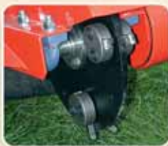
Disco ad 8 utensili "Carbide" Tête à 8 pointes "Carbide"