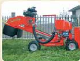
Braccio di lavoro telescopico Bras de coupe télescopique